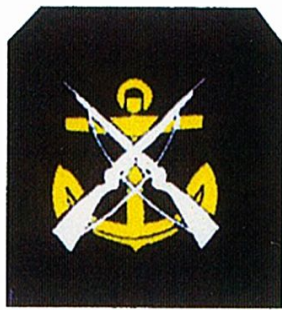
Infanterie de Marine