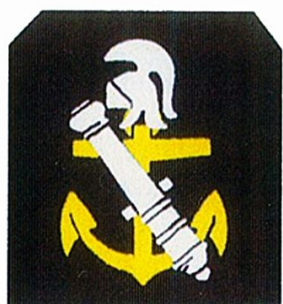
Réparateur armement naval