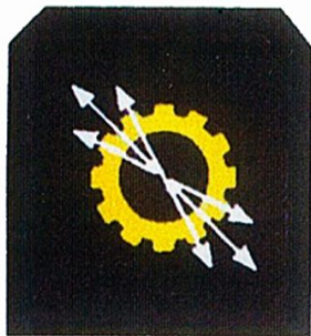
Electricien de Marine