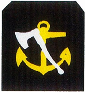
Charpentier de Marine